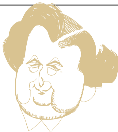
Caricatura de Puig Pujades, per Bagaria

A mb la represa democràtica s'inicià, encara que d'una manera tímida, la recuperació de la memòria històrica a la nostra ciutat. En el cas de Puig Pujades, l'any 1985, amb motiu del centenari de Narcís Monturiol, l'Ajuntament de Figueres reedità Vida d'heroi , la biografia que va escriure sobre l'inventor de la navegació submarina. Però no va ser fins a l'any 1999 quan l'Ajuntament va reivindicar l'obra i la trajectòria de Puig Pujades amb la commemoració del 50è aniversari de la seva mort, que, entre altres coses, va significar la seva incorporació al nomenclàtor de la ciutat i el trasllat, l'any següent, de les seves despulles des del cementiri del Voló al panteó de figuerencs il·lustres del cemen-