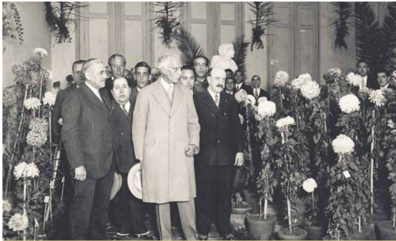
Visita del President Francesc Macià a Figueres el 1931. A la seva dreta, Josep Puig Pujades; a l'esquerra, l'alcalde Marià Pujulà

Fou també en aquest moment quan el discurs de renovació del republicanisme que impulsà Puig Pujades es veié complementat amb la conformació d'un programa de millora social tan ampli com ambicions. D'una banda, l'acostament de la cultura a la societat i, de l'altra, el foment de valors cívics i democràtics al poble. Mògut per la idea que l'autèntic progrés soci-