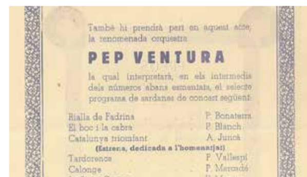
Programa de sardanes en l'homenatge a Puig Pujades del 31 de març de 1936

També ens hem basat en el programa de l'homenatge que es va fer a Puig Pujades el dia 31 de març del 1936 i les sardanes que la cobla Pep Ventura hi va interpretar. Es va estrenar Catalunya triomfant , que el compositor figuerenc Antoni Juncà li va dedicar i de la qual no tenim constància que