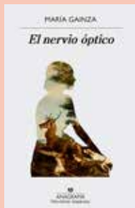
CLUB DE LECTURA 12.03