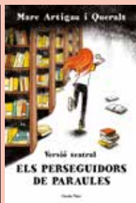
APRENC A LLEGIR 02.03