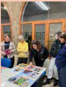
MOSTRA «HISTÒRIES OCULTES»