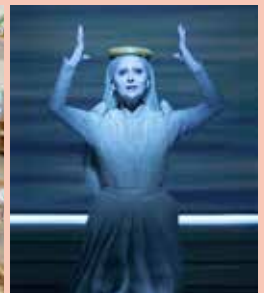
CLUB D'ÒPERA 11.03