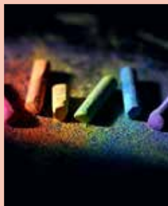
HORA DEL CONTE 23.03