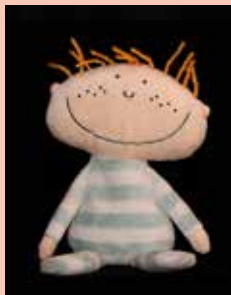
CONTES PER A NADONS 22.03