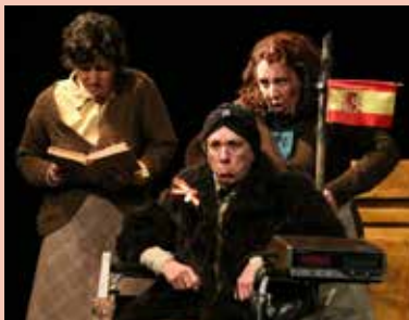
PENSÍO EDÈN 27.03