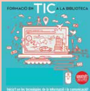
FORMACIÓ TIC 11.03