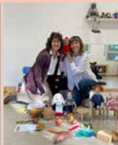
CONTES PER A NADONS 08.03