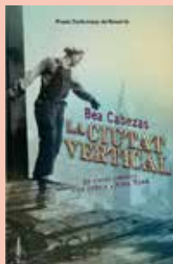
CLUB DE LECTURA 18.03