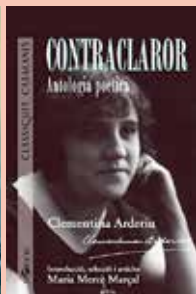
CLUB DE LECTURA 19.03